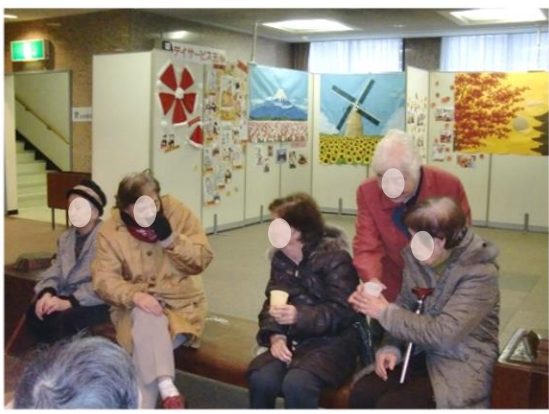
『作品展見学し談笑のご利用者』